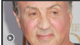
71-Jähriger lässt dementieren Frau wirft Sylvester Stallone Vergewaltigung vor